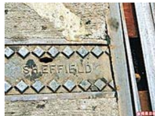
■ 今日時代廣場附近還可找到這