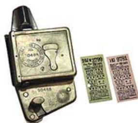
白銅製的車票打孔機，Eric 三年前